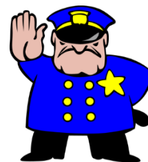
Figura 4. Papel de Comisión Colombia.

La Comisión Colombia no es un órgano que pueda crear leyes, pues como vimos, ese es el rol del Congreso. Sin embargo, la comisión puede plantar propuestas de trabajo y/o solución frente a la temática/problemática a tratar.