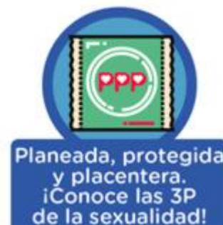
Figura 2. Atención integral 4.

Específicamente, las comisiones Bogotá (1 a 5) cuentan con el acompañamiento de la Subdirección para la Juventud de la Secretaría Distrital de Integración Social (SDIS), entidad del Distrito que, a través de la puesta en marcha de acciones para la prevención, promoción, protección, rehabilitación y restablecimiento de derechos, trabaja por la integración social de las personas, familias y comunidades de la ciudad (SDIS, s.f.).