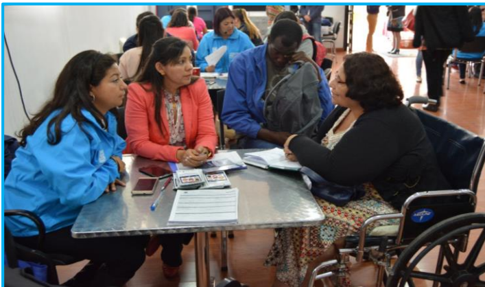
Secretaría Técnica apoyando las actividades del Sistema Distrital de Discapacidad

Una de las principales funciones de la Secretaría Técnica Distrital de Discapacidad (STDD) es coordinar