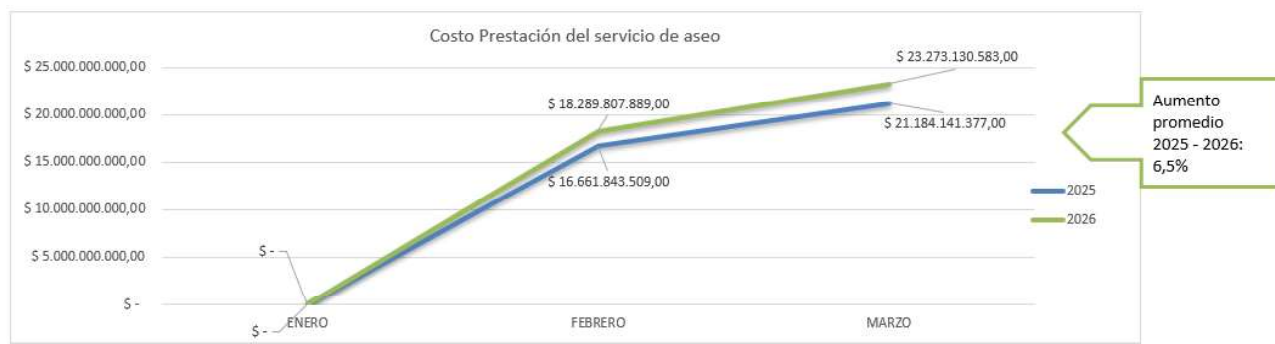
Gráfica No. 1 – Pagos por concepto de servicio de Aseo I Trimestre 2025-2026.

Se presentó una variación del 9.8% en el gasto referente al servicio de aseo, que, equivale a $3.716.953.586, y de los cuales se ilustra la tendencia correspondiente al primer trimestre de 2026: