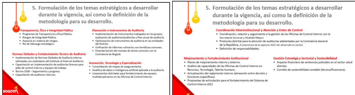
Resumen elaborado de la encuesta realizada a los miembros del Comité Distrital de Auditoría