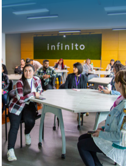
STEM para niñas y niños de 4º y 5º de primaria