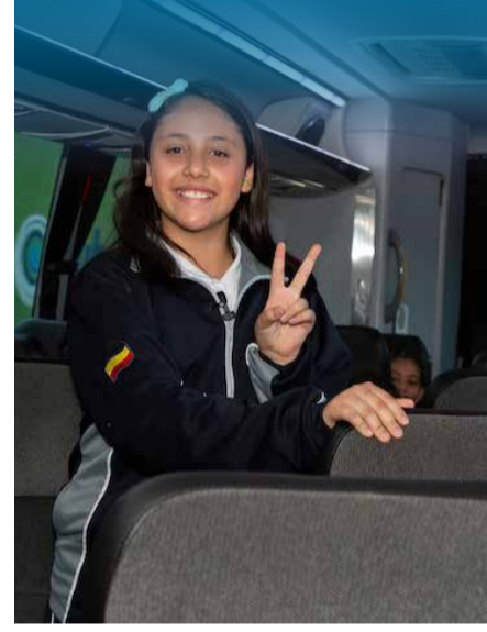
Viaje por la alimentación y el transporte escolar