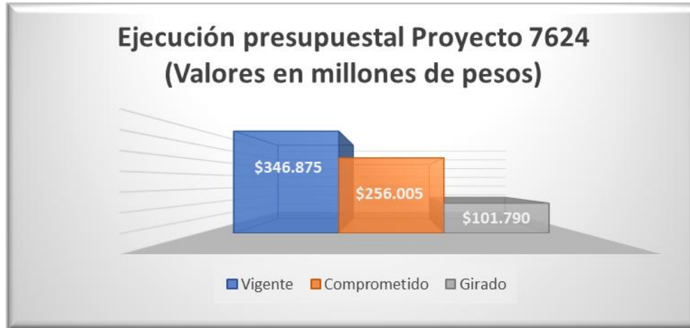
Gráfico 1. Ejecución presupuestal vigencia a 31 de marzo de 2026