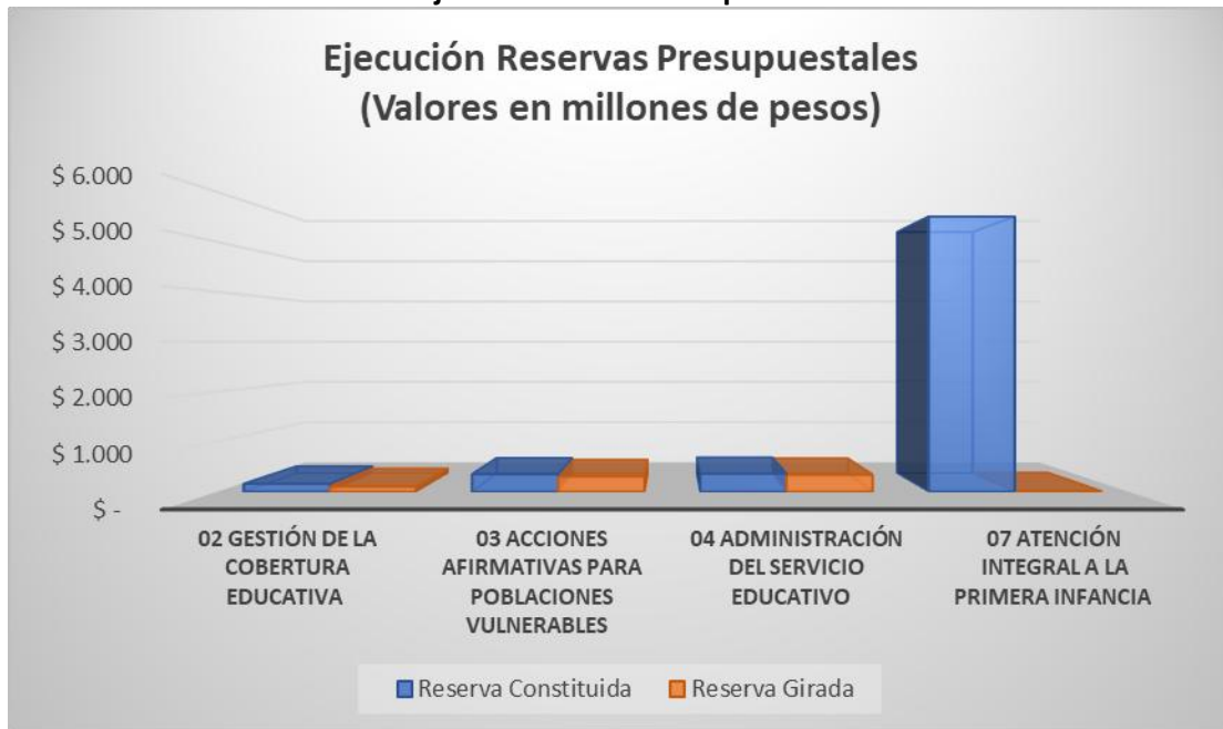
Gráfico 3. Ejecución de Reservas por Actividad