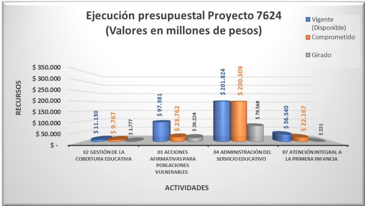
Gráfico 2. Ejecución Presupuestal Vigencia por Actividad