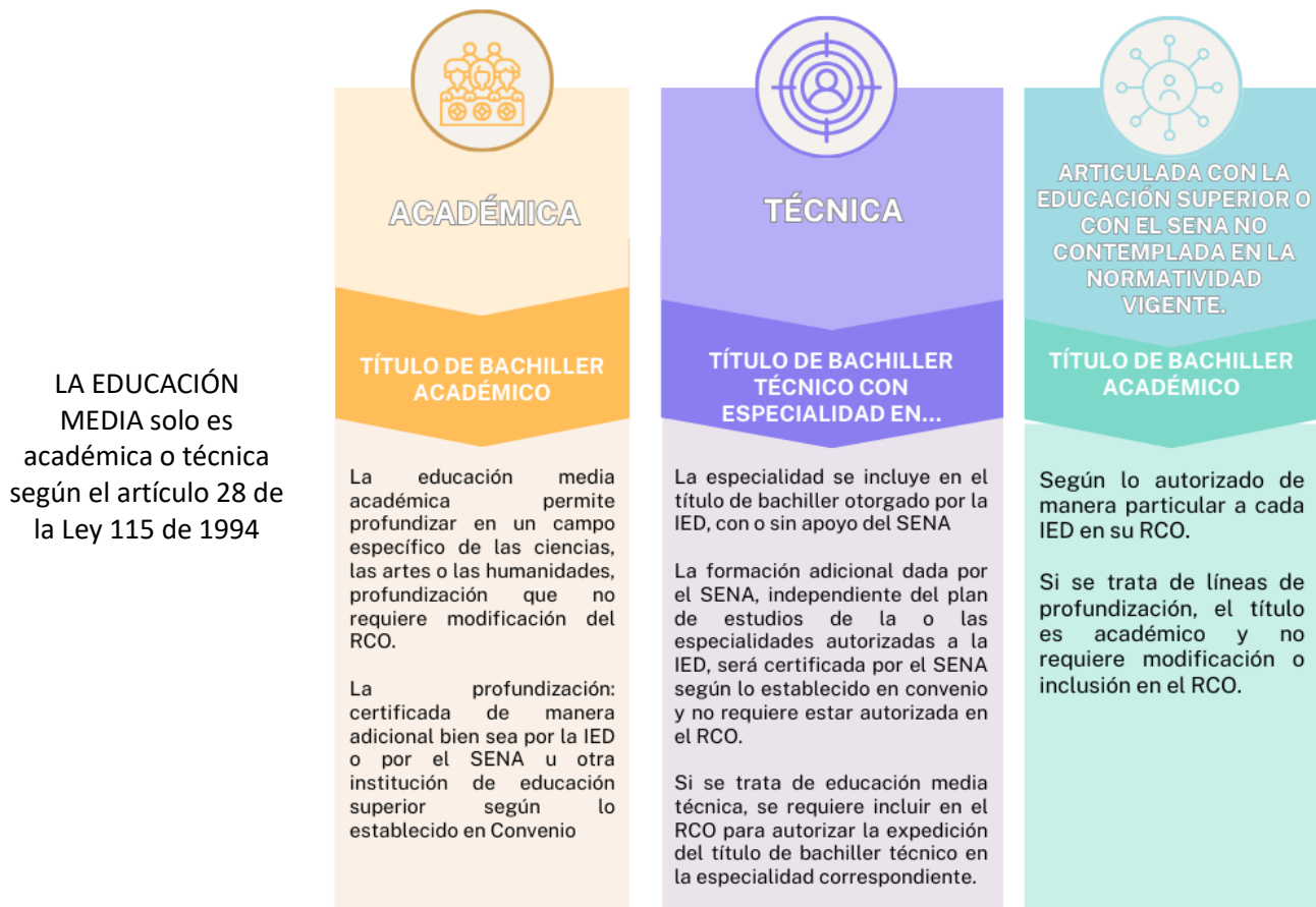
Ilustración 3 Titulación de bachilleres según el carácter de la educación media

Nota: La inclusión del término “técnico” en la denominación de nuevas IED, no es procedente por cuanto la ley 115 de 1994 considera el carácter técnico únicamente para el nivel de la educación media