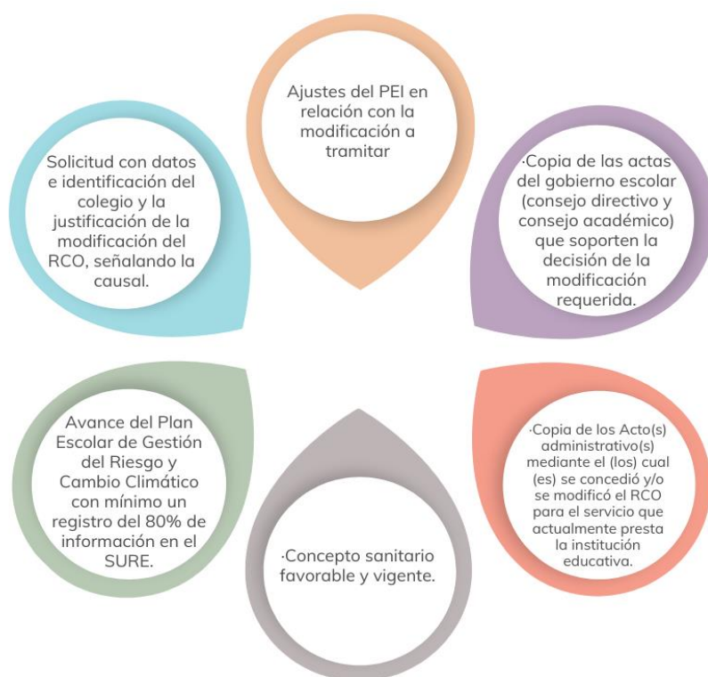
Ilustración 2 Documentos para solicitar modificación del RCO

El trámite de modificación del RCO, para estos dos casos, se adelanta aplicando el procedimiento descrito en el numeral 4 de estas orientaciones, para el cual se deben adjuntar los siguientes documentos: