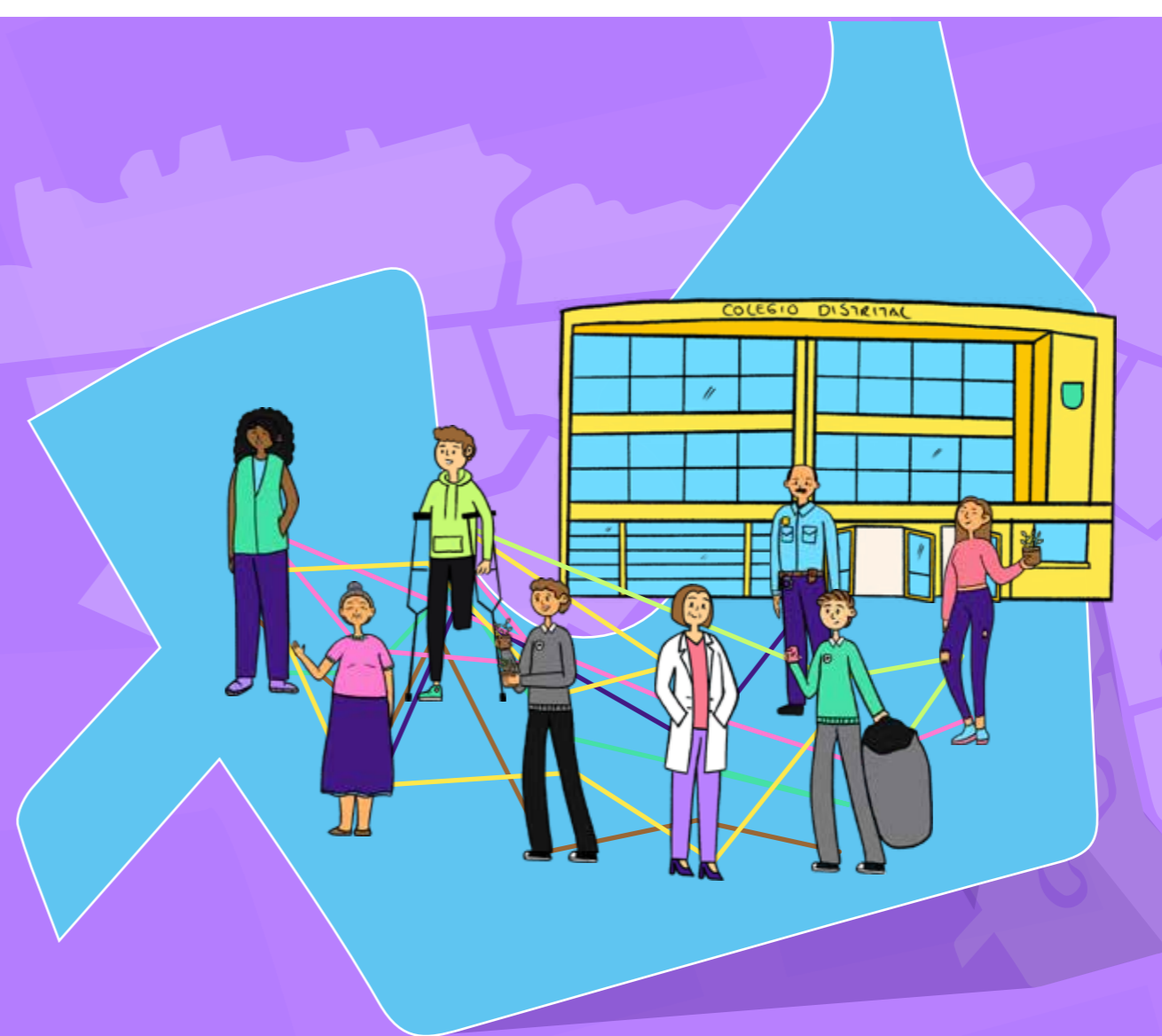
Localidad de Bosa