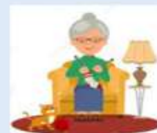
EDUCACIÓN PARA ADULTOS