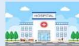
DOMICILIARIA U HOSPITALARIA