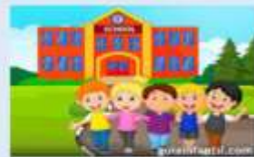
GENERAL O REGULAR